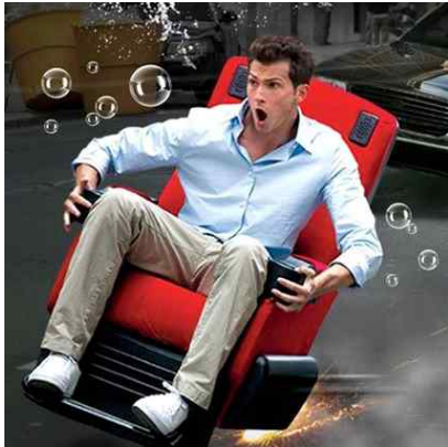
[▲그림 1. 4DX ]