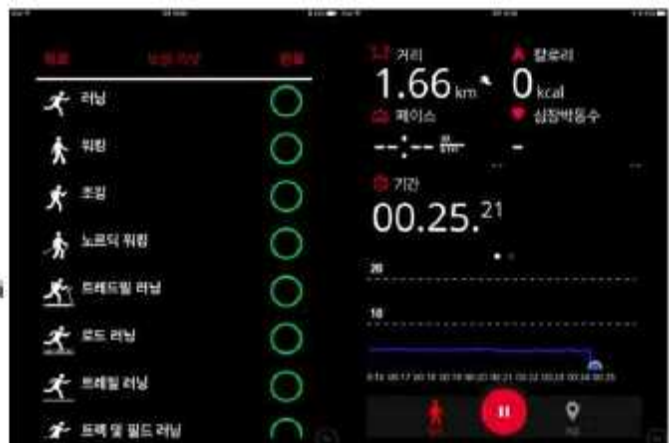
[스마트 신발 폴라(Polar)의 모습과 구동 애플리케이션]